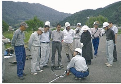
刈払機の取扱い実習