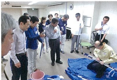
講習で清掃作業も受講